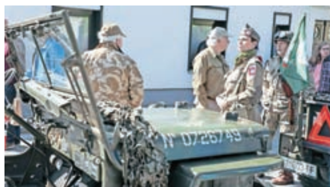
Najstarejši starodobniki so bili vojaški avtomobili iz vojnih let 1943–1945.