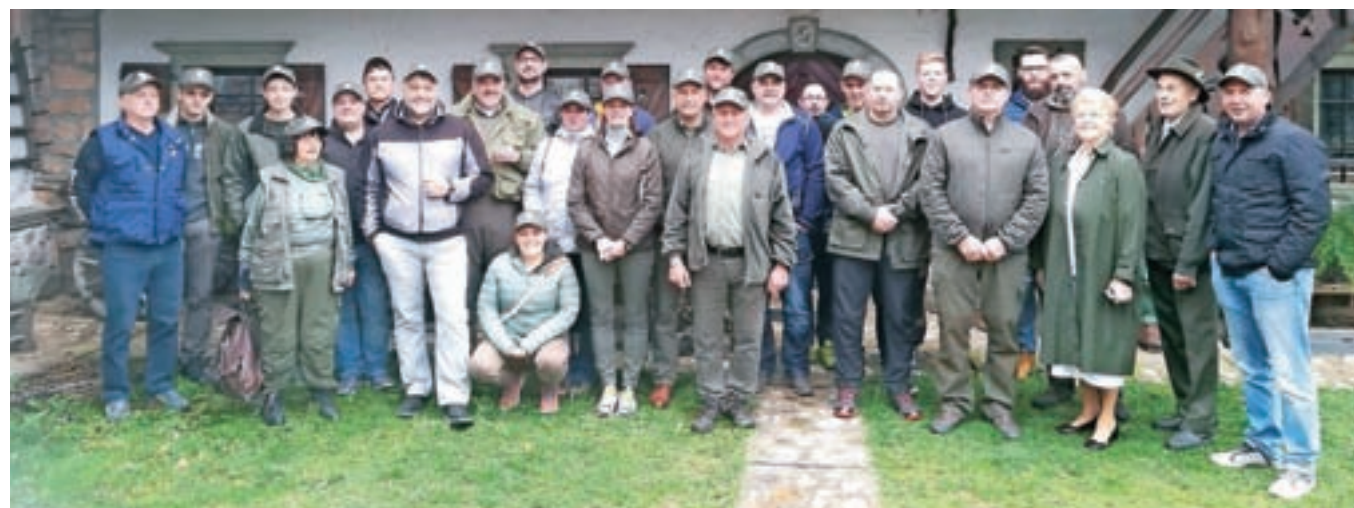
Zveza lovskih druženj Gorenjske ima sedež v občini Naklo, 25 kandidatov je spomladi uspešno opravilo lovski izpit.