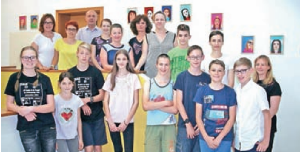
Najuspešnejši tekmovalci in področje, s katerega so prejeli zlato priznanje oziroma izjemno uvrstitev v državi. Na sliki skupaj z mentorji in ravnateljem.

Med številnimi tekmovalci, ki vsako leto sodelujejo na športnih tekmovanjih in na tekmovanjih iz znanj, je bilo v tem šolskem letu v Osnovni šoli Naklo 9 tekmovalcev, ki so posegli po najzlatnejših priznanjih.