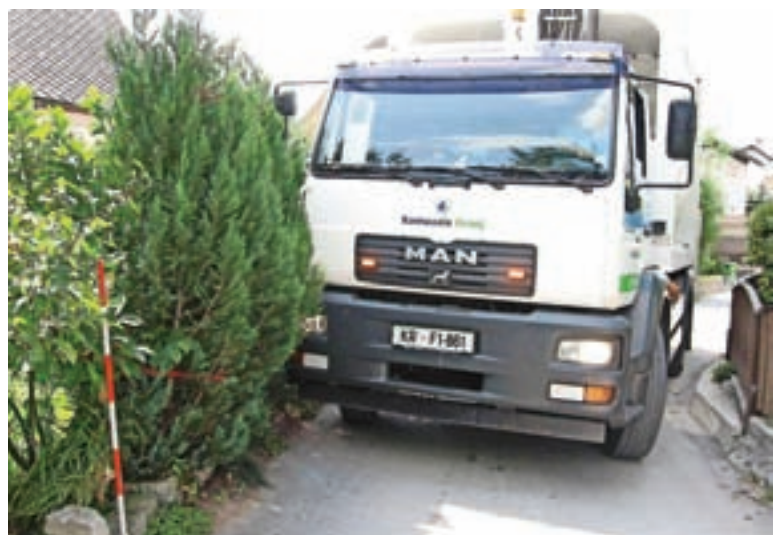
Otežen dostop do zabojnikov.

Dnevno se naše smetarske ekipe srečujejo s številnimi izzivi. Pogosto je dostop do zabojnikov otežen ali celo onemogočen. Predvsem v naseljih individualnih hiš razrašč-