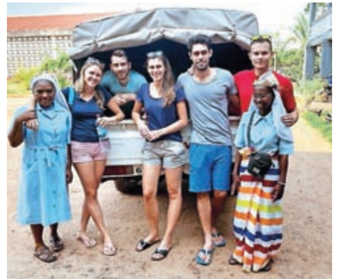
Po svojih najboljših močeh smo pomagali zelo velikemu številu pacientov.

Naši pacienti so bili večinoma otroci, med katerimi so bili številni podhranjeni in s tem še bolj izpostavljeni okužbam.