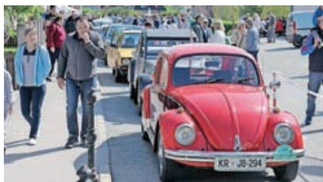
Parada se je iz središča kraja odpravila po občinskih vaseh – vse do Tržiča in nazaj.