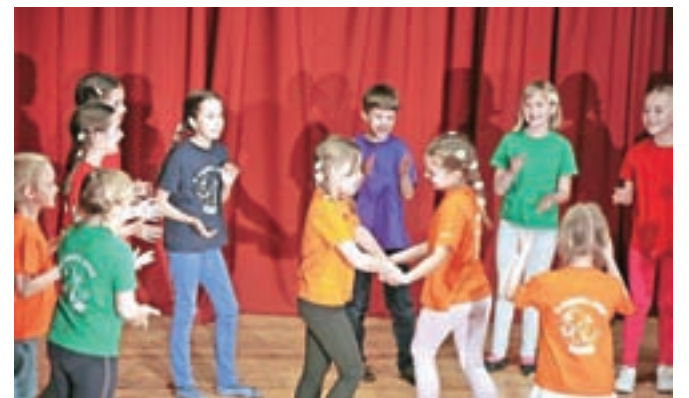
Predstavili so se tudi najmlajši.