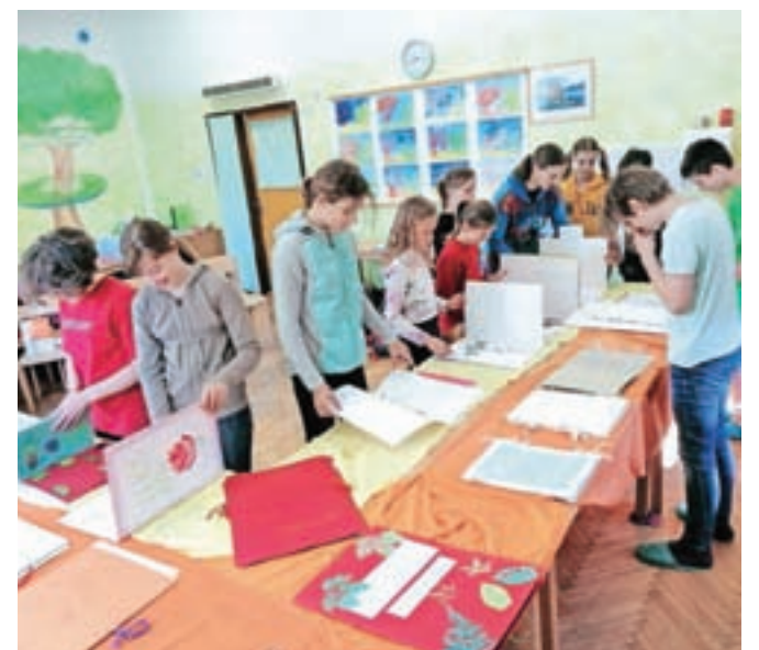
Vsako rastlino so opremili z imenom, datumom in krajem, kjer so jo nabrali.